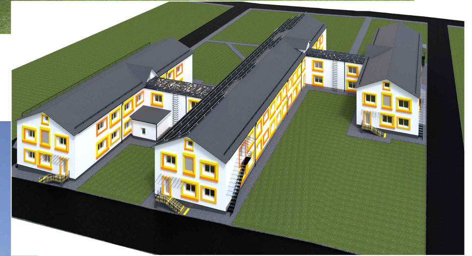
Перспективне зображення у вісях 1-6